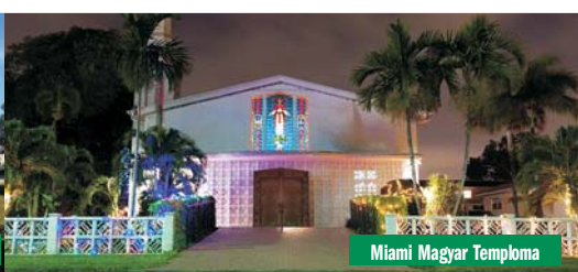
Miami Magyar Temploma