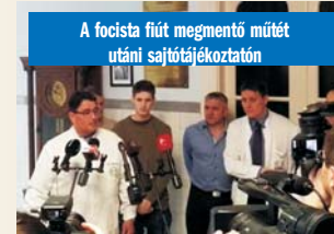
A focista fiút megmentő műtét utáni sajtótájékoztató

Mi hiányzik az életéből? – kérdeztük. „Egyetlen dolog – hangzott a válasz – ez pedig az idő.”