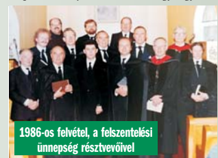
1986-os felvétel, a felszentelési ünnepség résztvevőivel

dekü szemléletet erősítve – mondja. – A presbitérium átalakítása békkészségben megtörtént, gazdaságilag is helyreállítottuk a szervezést, a vasárnapi iskolát, az ifjúsági csoportokat újra szerveztük, így egymás