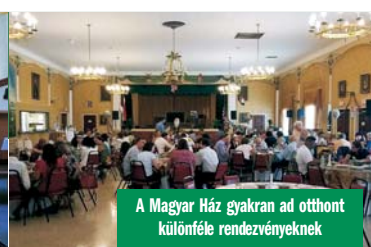
A Magyar Ház gyakran ad otthont különféle rendezvényeknek