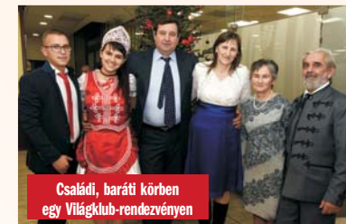
Családi, baráti körben egy Világklub-rendezvényen