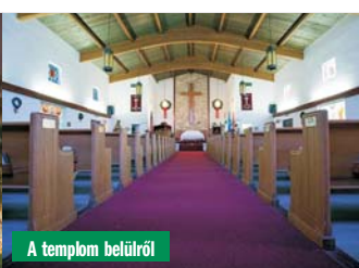
A templom belülről