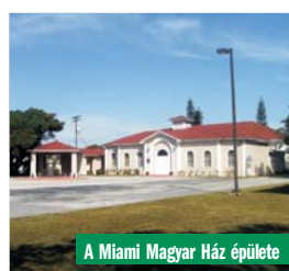
A Miami Magyar Ház épülete