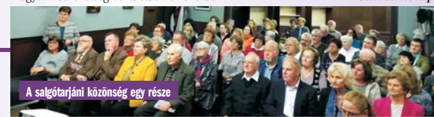
A salgótarjáni közönség egy része