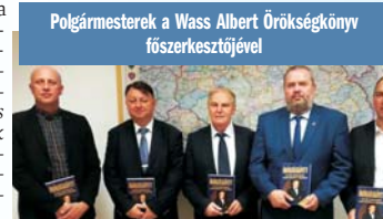
Polgármesterek a Wass Albert Örökségkönyv főszerkesztőjével

dás Miklós Görögkatolikus Általános Iskola diákjai és a Kis Rózsafa citerazenekar adott nagyszerű műsort, amelyet fogadás követett.