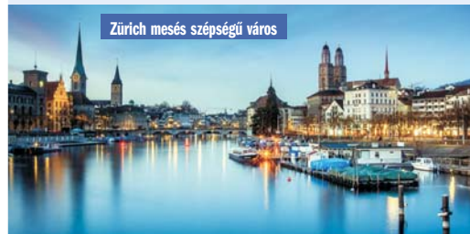
Zürich mesés szépségű város

jedelem szellemi örökségéről. Filmrészletek vetítésére is sor került az íróról készült Szalay Róbert portréfilmből, s a Duna Palotában rendezett Emlékvé dísztünnepségéről.