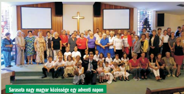
Sarasota nagy magyar közössége egy adventi napon