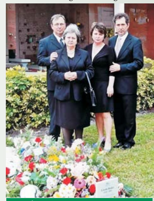
Édesapja temetésén a családjával

Öt esztendővel ezelőtt újabb fordulat állt be az életében: megüresedett Miami-ban a lelkészi állás, gyülekezeti szakadás történt, s őt kérték fel az ügyvezető lelkészi hivatás betöltésére, az egyházi élet rendbetételére. Erkölcsi kötelességének érezte a vállalat, hiszen édesapja 1983-tól évtizedeken át végzett itt szolgálatot. Bő-