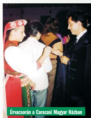
Úrvacsorán a Caracasi Magyar Házban

Mindkét tevékenység sikerre ítéltetett. A vállalkozás – egészségügyi endoszkópek javítása – száymalni kezdett, évről évre egyre eredményesebbek lettek, négy-öt esztendő múlva már közel félszáz embernek adtak munkát. 2000 elején társultak egy marketinges céggel, s 2014-re létszámuk elérte a 1200 főt. Ekkor eladták