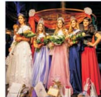
A tavalyi verseny győztesei

„A Világtalálkozó Szépe” cím odaítélése mértéktartó külsőségek, a rendezvény szellemiségéhez igazodó körülmények mellett.