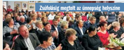
Zsűfólaság megtelt az ünnepség helyszínén