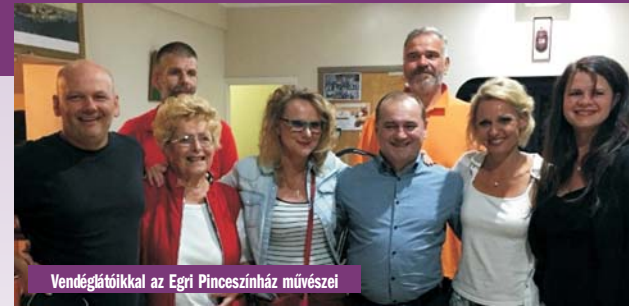
Vendéglátóikkal az Egri Pincészinház művészei