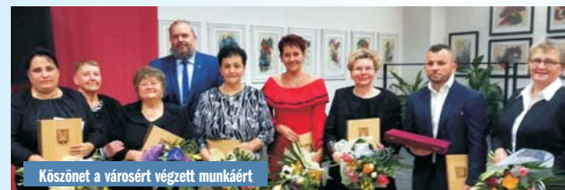
Köszönet a városért végzett munkáért