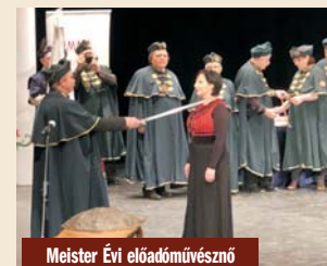
Meister Évi előadóművész