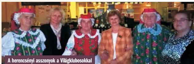
A hercensényi asszonyok a Világklubosokkal

Balassagyarmaton az Éden Rendezvényterem adott otthont a Panoráma Világklub 243. zászlóbontásának, itt alakult meg a társklub, kicsik és nagyok, fiatalok és idősek részvételével, a palóc néphagyományok ápolásának és a Wass Albert Emlékéneke a jegyében. Az egybegyűlteket