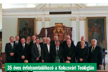
35 éves évfordulótalálkozó a Kolozsvári Teológian

A hit és az üzleti élet különös találkozása Amerikában