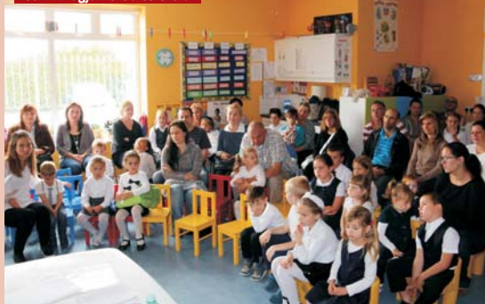
Cork-i Magyar Iskola és Óvoda

ahogy felmérje, milyen támogatásra lenne leginkább szükségük. Ezt követően osztottak szét 2018-ban 100 millió forintot célzottan hétvégi iskolák, 300 millió forintot pedig diaszpórában működő magyar szervezetek között. 2019-ben pedig összesen már 500 millió fo-