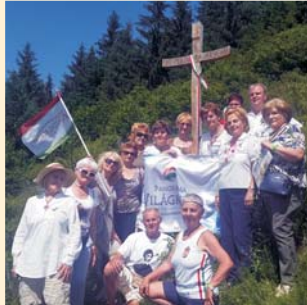
Világklub-kereszt a csíksomlyói nyeregben – a búcsún járt Világklubosokkal