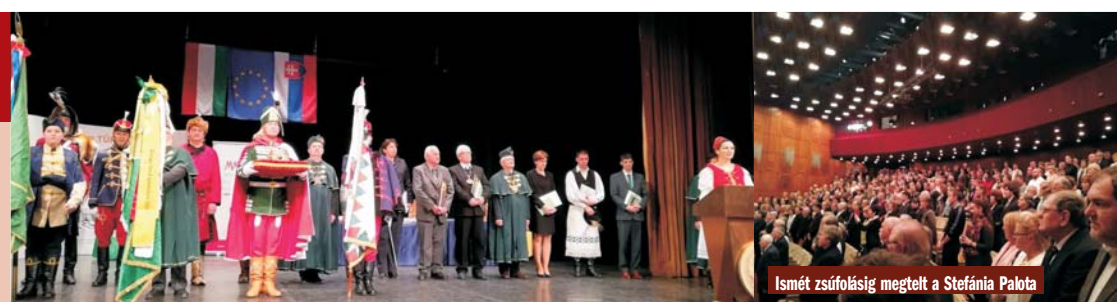
Ismét zsűfőliség megtelt a Stefánia Palota