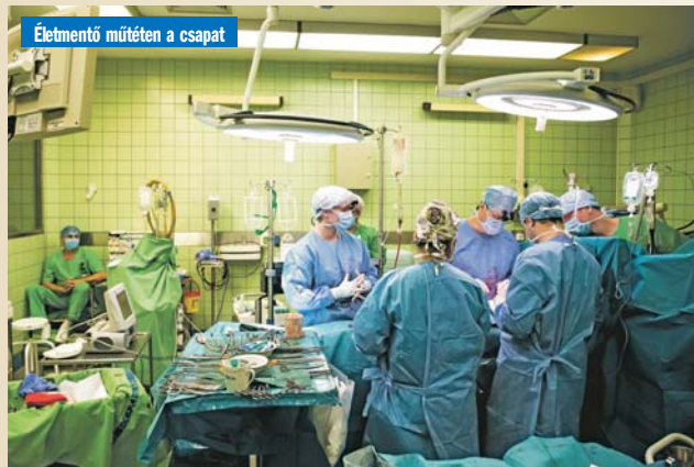
Életmentő műtéten a csapat