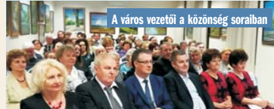
A város vezetői a közönség sorában