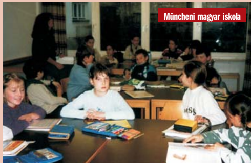
Müncheni magyar iskola

lamint az ott dolgozó pedagógusok bérkegésztésére használják fel. Az a tapasztalat, hogy egyre több szülő íratja be gyermekét hétvégi magyar iskolába, amelynek abban van fontos szerepe, hogy a diaszpórában élő gyerekek megismerjék a magyar nyelvet és a magyar kultúrát a többségi társadalomban.