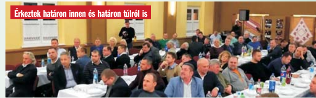
Érkeztek határon innen és határon túlról is

ságot ápoló példaértékű tevékenységéért. A továbbiakban többen kaptak elismerést a Nemzeti Összetartozás Napja szervezésében végzett munkájukért, majd Sasvári Sándor előadóművész kiváló műsorát követően egy közös vacsorával zárult a program.