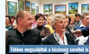
Többen megszólaltak a közönség sorából is