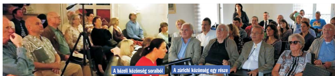
A bázei közönség sorából