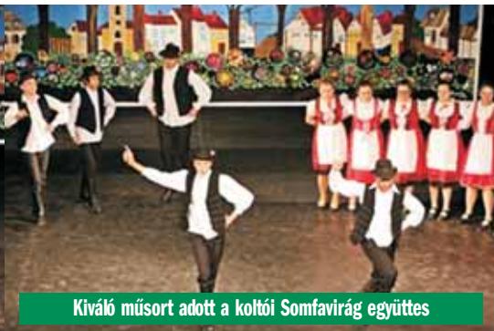
Kiváló műsort adott a koltói Somfavidék együttes