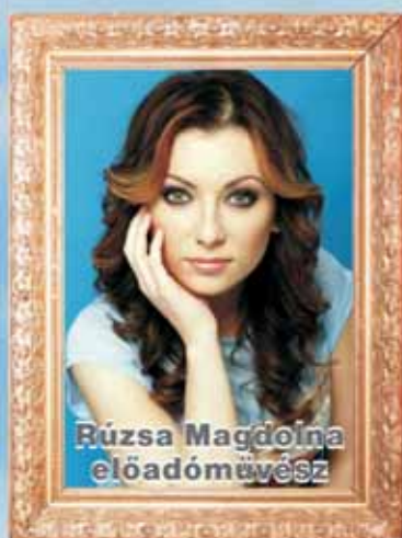
Rúza Magdolna előadóművész