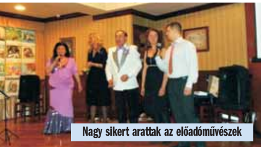
Nagy sikert arattak az előadóművészek