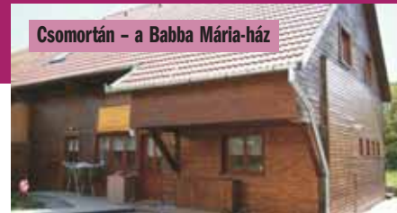
Csomortán - a Babba Mária-ház

zések vannak folyamatban a Fodor-teleken, ahol egy közösségi ház fog felépülni, és további 5 telekre Csobotfalván Csibész-családoknak szeretnének családi házat építeni.