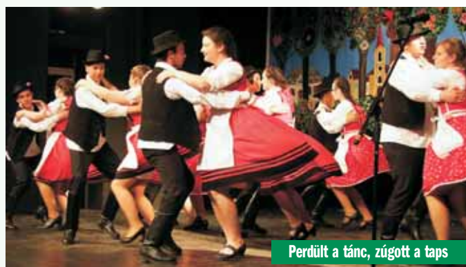
Perdült a tánc, zúgott a taps