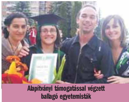
Alapítványi támogatással végzett hallgatók egyetemisták

Ebből a mozgalomból nőtt ki a Lazarus Alapítvány és annak tevékenysége. 2002-ben jött létre a budapesti Csibész Alapítványa, majd a csíksomlyói Csibész Ifjúsági Egyesület. E sokrétű tevékenységükhöz további házakat vásároltak. Ilyenek például: a Fodor-ház (közösségi ház) a Joachim-ház, Csíkszépvízen 6 ház, Csík-csomortánban 2 ház, a Nagyasszonyunk-ház, az Anna-ház,