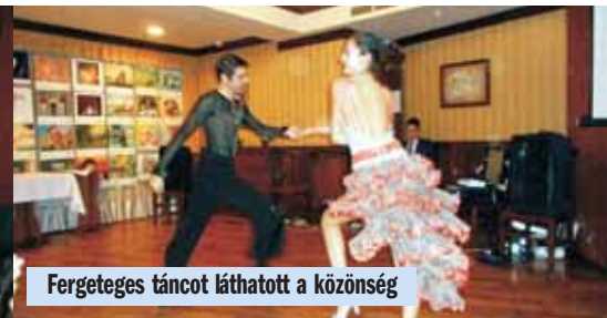
Fergeteges táncot láthatott a közönség