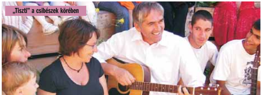
„Tiszti” a csibészek körében

Ebből a mozgalomból nőtt ki a Lazarus Alapítvány és annak tevékenysége. 2002-ben jött létre a budapesti Csibész Alapítványa, majd a csíksomlyói Csibész Ifjúsági Egyesület. E sokrétű tevékenységükhöz további házakat vásároltak. Ilyenek például: a Fodor-ház (közösségi ház) a Joachim-ház, Csíkszépvízen 6 ház, Csík-csomortánban 2 ház, a Nagyasszonyunk-ház, az Anna-ház,