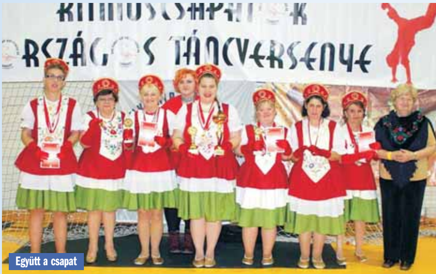
Együtt a csapat