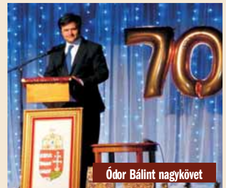
Ódor Bálint nagykövet

Ódor Bálint , Magyarország kanadai nagykövete ünnepi köszöntőjében elmondta: „Szerencsések Önök, hogy egy olyan városban élnek, ahol ilyen szép székelykapu van. Azt jelenti, hogy a vancouveri magyarok fontosnak tartják a gyökereiket, fontosnak tartják a magyarságukat.”