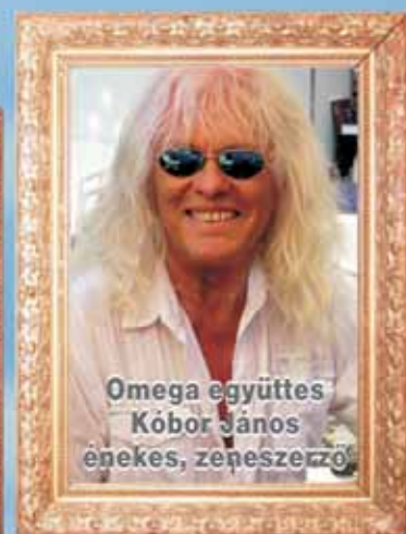
Omega együttes Kóbor János énekes, zeneszerző