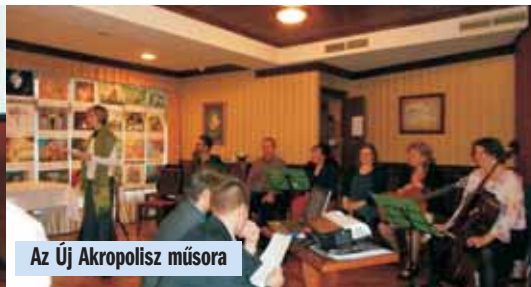
Az Új Akropolisz műsora