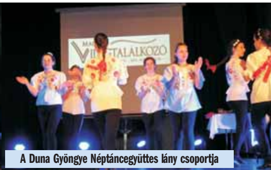
A Duna Gyöngye Néptáncgyűttes lány csoportja