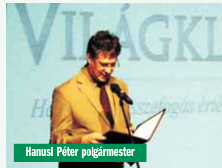
Hanusi Péter polgármester

A találkozót követő fogadásra mintegy 120-an maradtak, érdemes volt, mert tucatnyi házi készítésű sütemény, szendvics, az Anetta cukrászda Világklub embalmával készített tortája, a Nobilis aszalt gyümölcs termékek, Mátészalka „védjegye”, a Túró Rudi , s természetesen finom