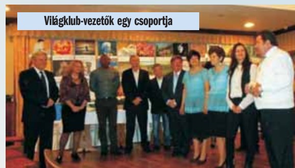
Világklub-vezetők egy csoportja