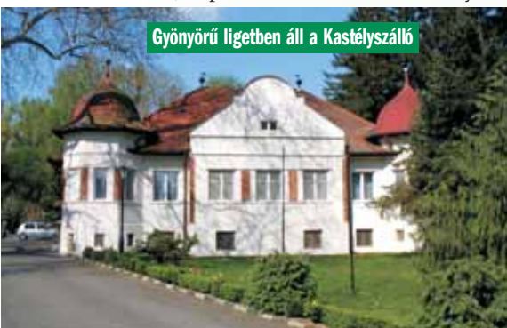
Gyönyörű ligetben áll a Kastélyszálló