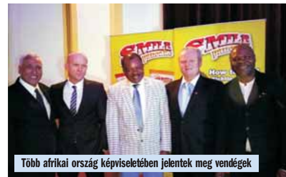
Több afrikai ország képviselőjében jelentek meg vendégek