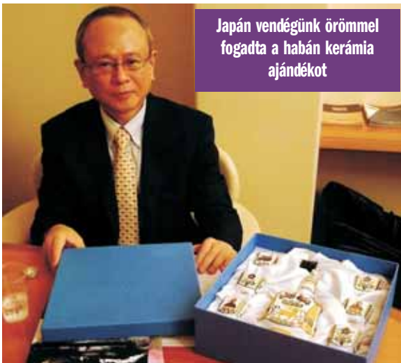
Japán vendégünk örömmel fogadta a habán kerámia ajándékot

Megtudtam, hogy az üldözések elől menekülő anabaptisták egyrésze Észak-Olaszországban, más csoportjuk Dél Ausztráliában telepedett le, és elsajátították a mindenkori, a helyi kerá-