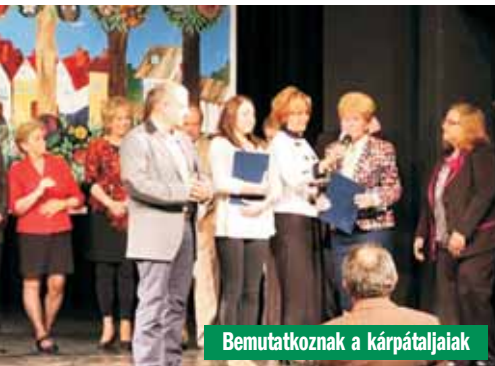
Bemutatkoznak a kárpátaljaiak