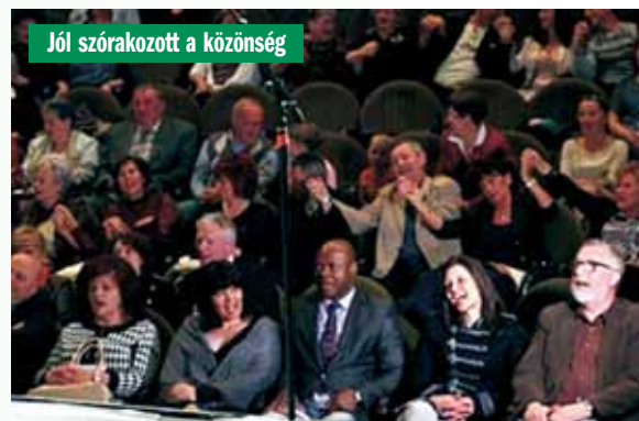
Jól szórakozott a közönség