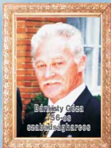
Bánkóty Géza 56-os szabadságharcos