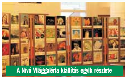
A Nívó Világgaléria kiállítás egyik részlete

A program mindvégig végig kellemes és színvonalas. Árad, mint egy békés folyó. Nem tekingetsz folyton az órára, nem várod, legyen már vége, élvezed, és tapsolsz. Őszintén és olykor lelkesülten. Nincs szükség sok beszédre, az összefoglaló kisfilmek hamar megismertetik a Panoráma Világklub és a Magyar Világtalálkozók történetét, tevékenységét a kívüllőkkel is. A szólóénekesek már egy befogadó, nyitott közösség előtt lépnek színpadra.