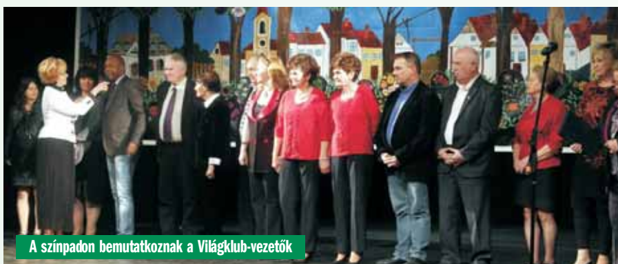
A színpadon bemutatkoznak a Világklub-vezetők

Aki ezen a hétvégén kocsiba ült, vagy vonatra szállt, hogy Mátészalkára utazzék, jól tette, hogy elindult. A Panoráma Világklub mátészalkai, kisvárdai és nyírbátori társklubjai hívták meg barátait a két napos közös találkozóra. Előbb a csaknem zsúfolásig megtelt színházterem adott otthont a felejthetetlen rendezvénynek, amely a fogadást követően egy éjfélbe nyúlt kellemes hangulatú vacsorával zárult. Másnap pedig a közeli Nyírbátor és Máriapócs történelmi nevezetességeivel ismerkedtek meg a Világklubosok.