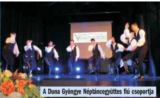
A Duna Gyöngye Néptáncgyűttes fiú csoportja