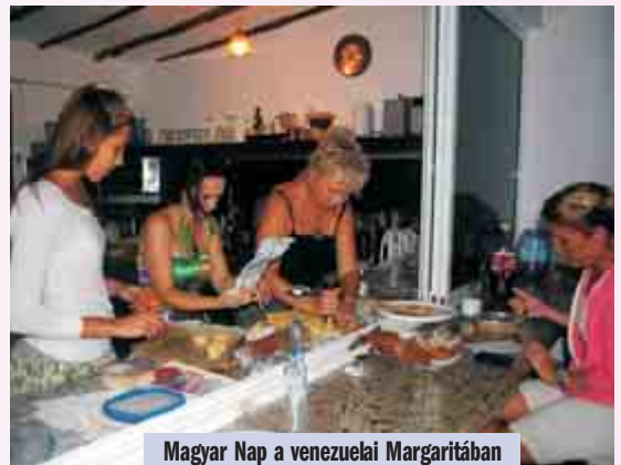
Magyar Nap a venezuelai Margaritában

Köszönjük vendéglátóinknak, segítőknek ezt a felejthetetlen utazást, a sok