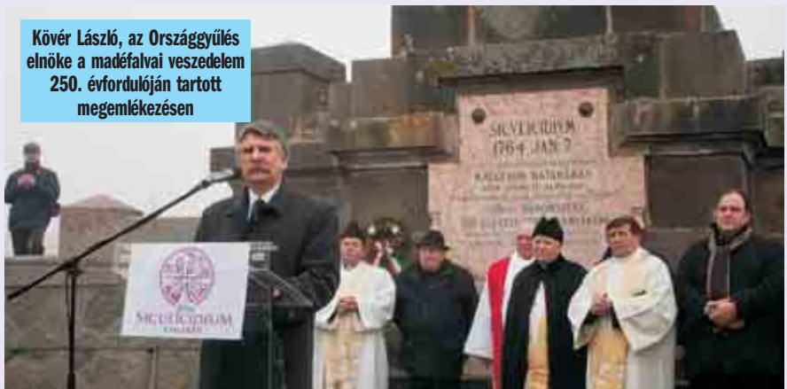
Kövér László, az Országgyűlés elnöke a mádэфalvi veszedelem 250. évfordulóján tartott megemlékezésen

ségi ügyeinket hűtlen vezetőkre”. Úgy vélte, nem szabad megengedni, hogy „Bukarestben, Budapesten vagy Brüsszelben mások döntsenek rólunk, nélkülünk”.