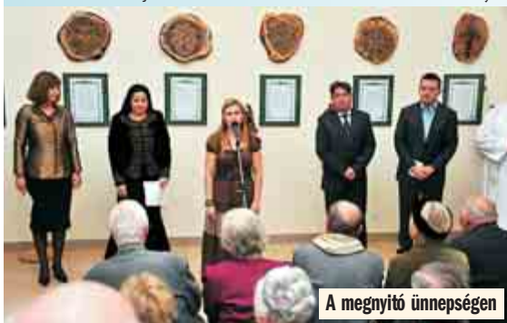
A megnyitó ünnepségen

- Ez egy kulturális központ lesz, hiszen a művésznő nemcsak saját remekműveinek, hanem más alkotók munkáinak is helyet biztosít. A közeljövőben egy olyan fantasztikus kulturális centrum jö-