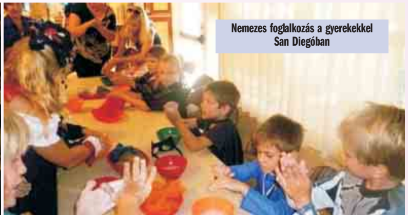
Nemeses foglalkozás a gyerekekkel San Diegóban