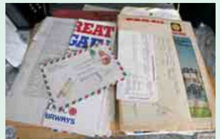
Felül a Kanadai/Amerikai Magyarság alapító-tulajdonosához, Vörösváry Istvánhoz írt levél borítékja

Egy későbbi kötetben a forradalom utáni, 1959–60-ig tartó időszak, a harmadikban az ezt követő rádiós munkássága kerülhet sorra Márainak.