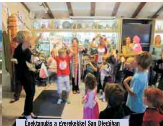
Énektanulás a gyerekekkel San Diegóban