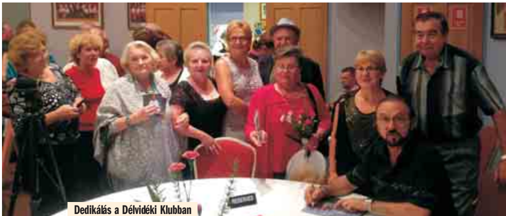
Dedikálás a Délvidéki Klubban

„Ezer torokból...” Keressük a legszebb tíz magyar népdalt!