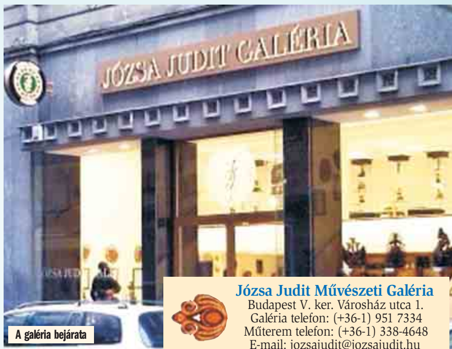
A galéria bejárata