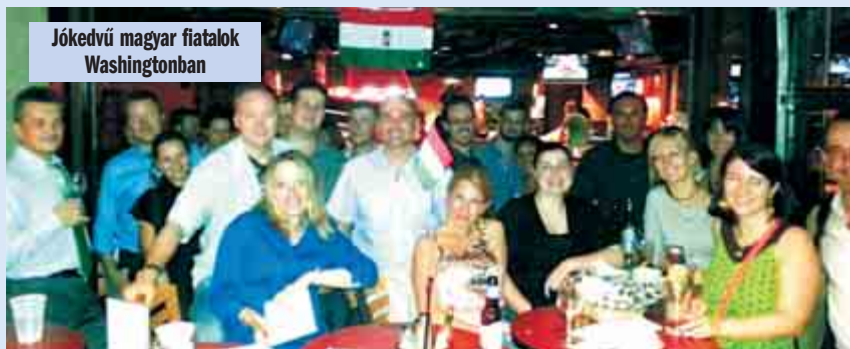
Jókedvű magyar fiatalok Washingtonban

Aztán jön az amerikai csapat. Mindannyian ugyanúgy ünnepeljük őket is. Nincs ezzel semmi baj. Azokkal van inkább baj, akik nem büszke magyarok, akik nem látogatják hazafias szeretetből ezeket rendezvényeket, hanem otthon pizsmognak, esetleg éppen le-