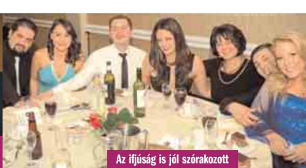
Az ifjúság is jól szórakozott