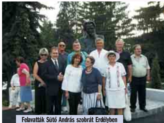
Felavatták Sütő András szobrát Erdélyben

Összegzésképpen: utaztunk 36 ezer km-t, három kontinensen, három országgal (Amerika négy államában), minden-