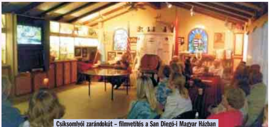
Csíksomlyói zarándokút – filmvetítés a San Diegó-i Magyar Házban