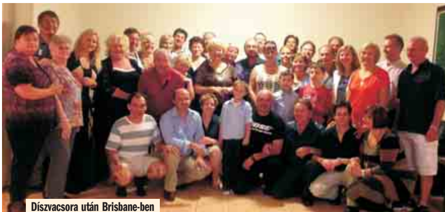
Díszvacsora után Brisbane-ben

A Gold Coast-i magyarok szép számmal érkeztek a közkedvelt erdélyi származású – jelenleg Svédországban élő – énekes koncertjére. A már jól ismert vendégművész második alkalommal látogatott el az Aranypartra. Akadtak olyanok is, akik DVD-ről, vagy CD-ről már ismerték különös orgánumát, de Tamás Gábor t „élőben” hallani, különleges élmény.