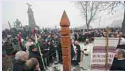
Tamás József püspök áldotta meg a Bukovinai Székelyek Országos Szövetsége által állított kopijafát

Magyarország 2010-ben megválasztott vezetői nevében szólna kijelentette, a mádэфalvi veszedelem után elmenekült székelyek emléke „arra kötelez, hogy soha ne bízzuk közös-