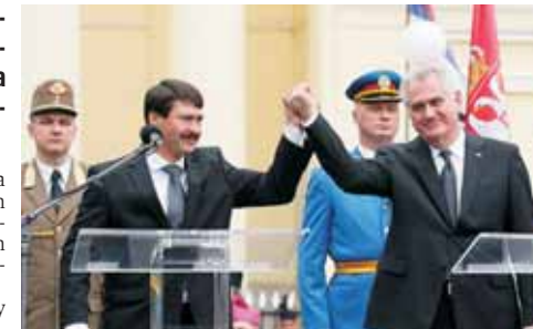
Történelmi megbékélés Csúrogon: Áder János köztársasági elnök és Tomislav Nikolic szerb államfő közfőgása

Áder János bocsánatkérésének előzménye az, hogy néhány nappal korábban a szerb parlament elítélte az 1944-45-ös délvidéki vérengzést. A II. világháború végén 15-20 ezer magyar esett Tito partizánjainak áldozatául.