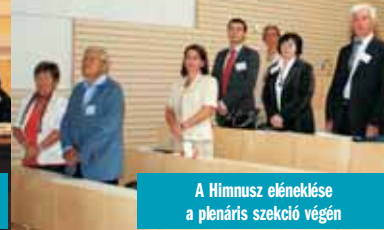
A Himmusz eléneklése a plenárius szekció végén