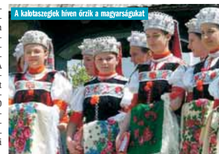
A kalotaszlegiek híven őrzik a magyarságukat

Év végére meglesz az ötszázévezredik magyar állampolgár a határon túlról – jelentette ki Semjén Zoltán az Eötvös Loránd Tudományegyetem hatodik Kárpát-medencei Magyar Nyári Egyetemének megnyitói ünnepségén. A nemzetpolitikáért felelős miniszterelnök-helyettes közölte: most tartunk a 470 ezredik állampolgársági igénylésnél, mintegy 400 ezren pedig már letették az állampolgári esküt, ami által magyar állampolgárokká váltak, s így közjogi értelemben is lehet egyesíteni a nemzetet.