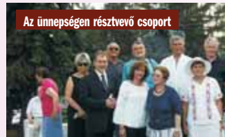
Az ünnepségen résztvevő csoport

köszöntő között felszólalt még Fekete György, a Magyar Művészeti Akadémia elnöke is – többek között. A szónokok sorát dr. Ferenczy Ferenc, a szoborállítás kezdeményezője zá- rta. Ezt követően megtörtént a szobor leleple- zése, amely meghitt pillanatot a történelmi egyházak képviselőinek áldása követett.