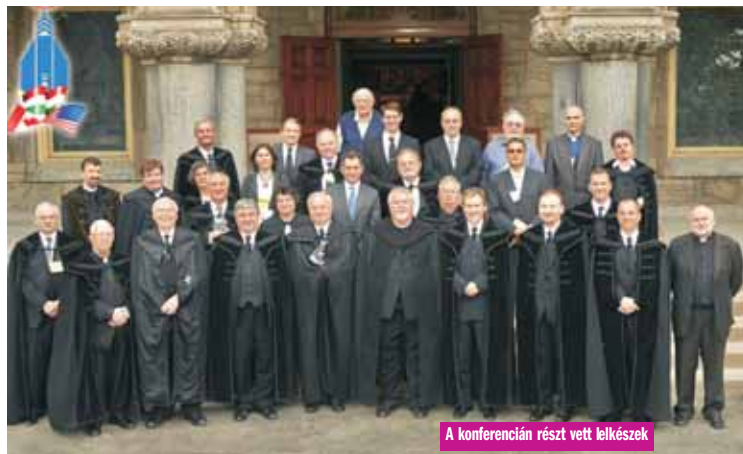
A konferencián részt vett lelkészek