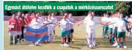
Egyébként átölelve kezdték a csapatok a mérkőzésorosozatot

Több mint húsz éve játékosként, majd játékos-szervezőként vettem részt futballtornákon. A bennem feszülő érzések és indulatok arra a cselekvésre készítettek, tegyék-tegyünk a határon túli és a világ magyarságáért. Különböző szervezési és anyagi nehézségek sem tudtak meghátrálásra bírni. Így sikerült végül is, amikor 13 éve Budapestről Örkénybe költöztem, addigra már a történelmi Magyarország majdnem összes elszakított területeiről csapatokat összehívni.