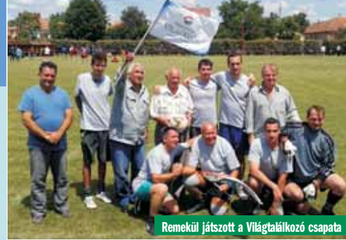
Remekül játszott a Világtalálkozó csapata