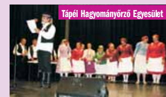
Tápiéi Hagymányörző Egyesület

A rendezvény támogatói: Magyar Élet hetilap (Sydney), Csongrád Megyei Közygűlés, Sándorfalva Önkormányzata, Zsombó Önkormányzat, Békés Város Önkormányzata, Ópusztaszeri Önkormányzat, Ópusztaszeri Emlékpark, Panoráma Világklub, Profil-Copy Kft. Szeged, Ópusztaszeri Mózes-vendégház, Mihazánk Könyvkiadó Kft., Szegedma.hu internetes újság, Szegedi Hagymányörző és Városképvédő Egyesület, Sándorfalvi Citerások Egyesülete, Világ Magyarsága hetilap, Délmagyarság Szeged, Kisújság Melbourne, Hotel Korona Szeged, American Hungarian Panoráma magazin.