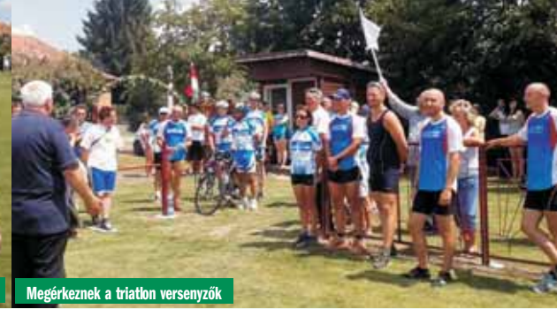
Megérkeznek a triatlon versenyzők

Magyarok Világkupája – 13 csapat részvételével – Buzánszky Jenő volt a fővédnök